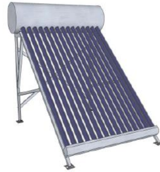
Surinkto saulės kolektoriaus vaizdas

Patikrinkite dar kartą visus rėmo sujungimo taškus, konstrukcijos geometriją ir tvirtinimo prie stogo patikimumą.